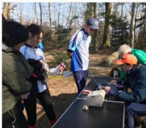
Un point de contrôle lors d'une course à Prévondavaux-Burtigny, en mars 2025.

– Samedi 2 mai à Divonne-les-Bains (Mont Mussy) – Samedi 16 mai à Bonmont (VD) – Samedi 30 mai à Versoix (GE) – Samedi 13 juin à Vesancy Pour chacune de ces courses il faut se rendre sur le site internet du club pour connaître plus exacte-